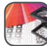
Druck bis zu 8 Farben Print up to 8 colors Nadruk do 8 kolorów

bis zu up to az do 50% weniger CO 2 Emission less CO 2 Emission mniej CO 2 emisji