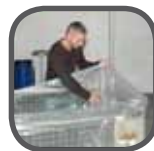
Gitterboxeinleger Pallet cage inlays Wkłady do Gitterboxów