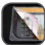
Kaschierfolie Laminate film Folia do lamino- wania