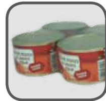
Konserven Canned goods Konserwy