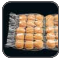
Backwaren/TK-Ware Pastries/deep- freeze Pieczywo/produkty głębokiego mrożenia