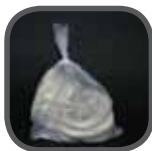
HDPE Folie ab 8µm HDPE film starting at 8 microns Folia HDPE od 8µm