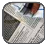
Papierersatzfolie Paper-like film Folia do tłuszczów spożywczych