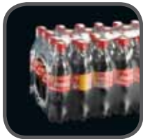
Getränkeindustrie Beverage industry Przemysł napojowy