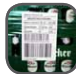
Bandrolierfolie banding-film Folia na banderole