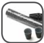
GLASIT-Folie Glasit-film Folia Glasit