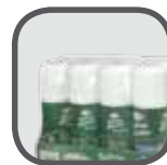
Schrumpffolie Shrink film Folia termokur- czliwa