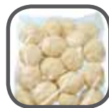
Tiefkühlfolie/ FFS-Folie Deep-freeze film/ FFS film Folia do głębokiego mrożenia