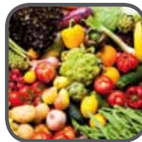
Fleisch, Fisch, Gemüse, Früchte Meat, fish, vegetables, fruit Mięso, ryby, owoce, warzywa